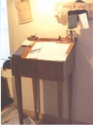
oben: Rekonstruktion des Zimmers von Dunant mit seinem Lehnstuhl